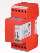
953 400 DEHNrail M 4P 255

Quadro a bordo macchina protezione da sovratensioni