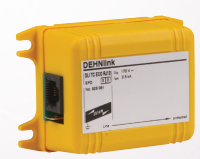
929 081 DEHNlink TC ECO RJ11

Telefono, ADSL, ISDN protezione da sovratensioni