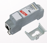
929 121 DEHNpatch M

Rete informatica protezione da sovratensioni