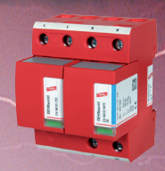
951 110 DEHNventil M TT 2P 255

Quadro secondario (centralino) protezione da sovratensioni