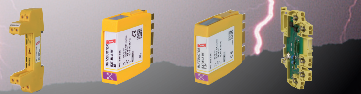
920 300 BXT BAS 920 324 BXT ML4 BE 24 920 224 BXT ML2 BE S 24 919 921 DCO RK ME 24

Comando Misura Controllo protezione da sovratensioni