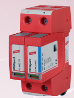
952 110 DEHNguard M TT 2P 275

Quadro secondario (centralino) protezione da sovratensioni