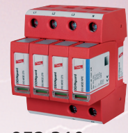
952 310 DEHNguard M TT 275

Quadro secondario (centralino) protezione da sovratensioni