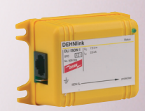
929 024 DEHNlink ISDN

Utenza finale (PC, TV) protezione da sovratensioni