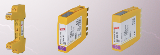
920 300 BXT BAS 920 347 BXT ML4 BD 180 920 247 BXT ML2 BD 180

Telefono, ISDN (U K0 ), ADSL protezione da sovratensioni