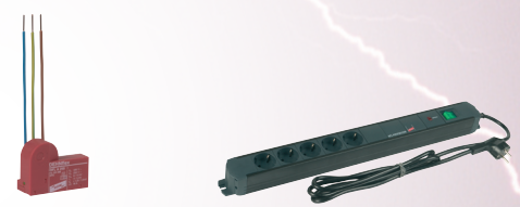
924 389 DEHNflex A 255 912 260 SFL PRO

Presenza utenza finale protezione da sovratensioni